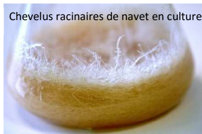
Chevelus racinaires de navet en culture

L’objectif de cette levée de fonds est d’accélérer les recherches sur de nouvelles cibles thérapeutiques.