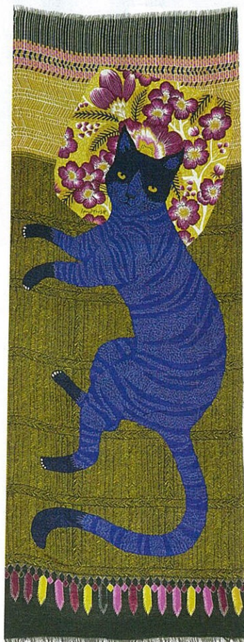
Le foulard Enki blue kaki