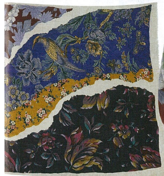
Le foulard Artémise

Avec Inouïtoosh, l'écharpe est révolutionnée. Sa force, c'est sa patte créative. Cette marque de fabrique est rendue possible par un dessin à la main et un tissage manufacturé. Une technique ancestrale et délicate qu'Inouïtoosh est allée chercher ➡