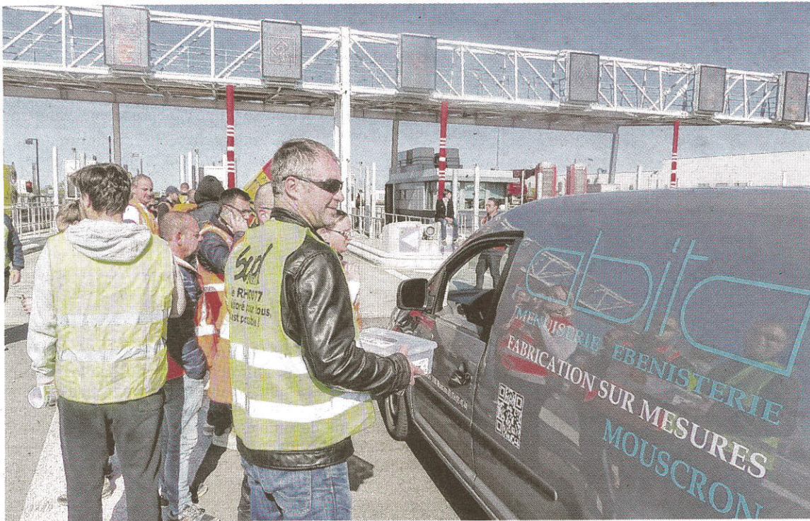
Les cheminots ont levé les barrières du péage Jules-Verne à Boves. L'opération a été très appréciée des automobilistes.

BOVES Les cheminots en grève ont mené hier une opération barrières levées sur l'A 29. Gros succès.