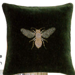
Bee © Inouïtoosh

“ CHAQUE PIÈCE EST COMME UNE ŒUVRE ET RACONTE UNE HISTOIRE À LA MANIÈRE D'UN TABLEAU .